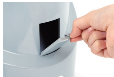
① 동전걸림제거 커버의 튀어나온 부분을 아래로 내리며 밖으로 기울여 커버를 열어줍니다.