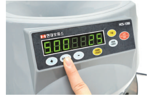
② 권종별 수량설정 버튼으로 권종을 선택해준 뒤 수량설정과 +/- 버튼으로 계수할 만큼 설정해 줍니다.