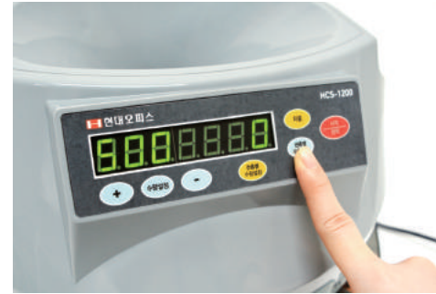
① 권종별 수량확인 버튼을 누르면 왼쪽-권종/오른쪽-계수 할 동전의 수량이 표시됩니다.