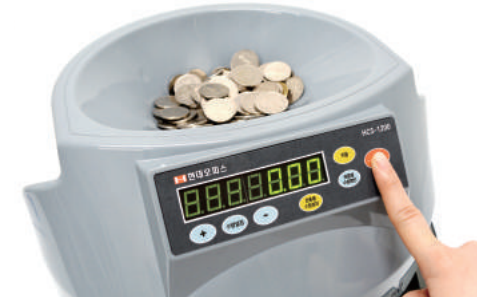
③ 시작/정지 버튼을 눌러 계수를 시작해 줍니다.

*설정하신 갯수보다 1~2개 정도의 오차범위가 생길 수 있습니다. 권종별 계수된 수량을 확인해주세요.