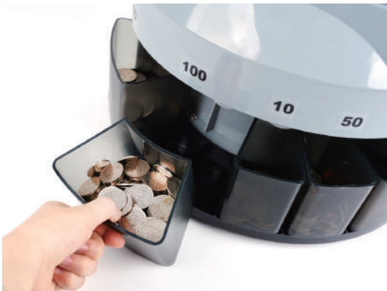
분리형 스테커에 권종별로 분류 및 계수가 완료됩니다.