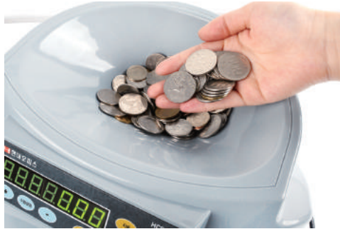
② 분류할 동전을 호퍼에 넣어줍니다.