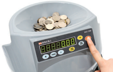
③ 시작/정지 버튼을 눌러 분류를 시작해 줍니다. 호퍼에 동전이 없는 경우 시작/정지 버튼을 한번 더 누르면 작동이 멈춥니다.