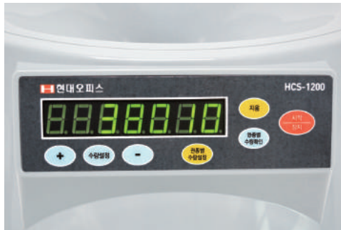
④ 디스플레이에 총 합계 금액이 표시됩니다. *총 합계금액이 표시된 상태에서 "지움" 버튼을 누르면 금액이 초기화 되므로 유의하시기 바랍니다.