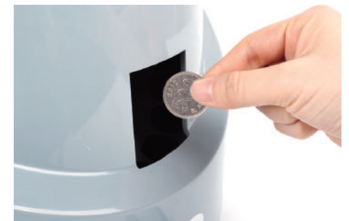
② 걸린 동전을 빼 줍니다.